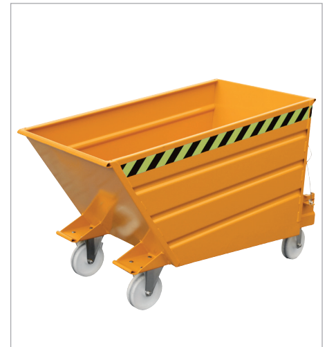
VD mit Rollen