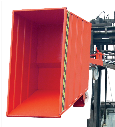
VG mit Rollen