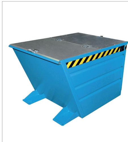
VG mit Deckel