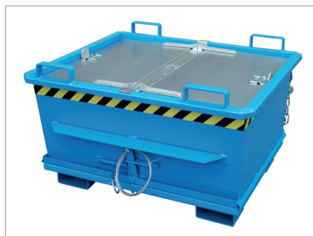
BKB mit Deckel