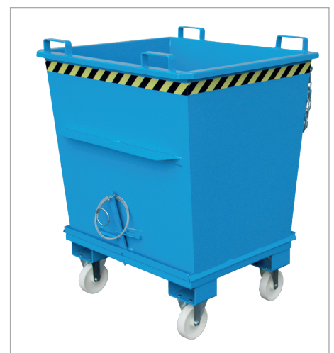
BKB mit Rollen