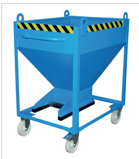
SR-D mit Kranösen