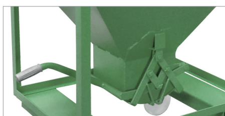
Spezial-Handhebel-Scherenverschluss (SR, SG, SRE)