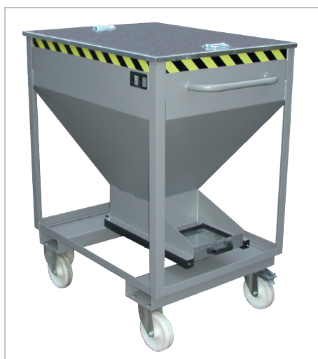
SRE-D mit Deckel