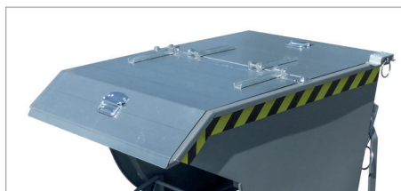
SKM mit Deckel