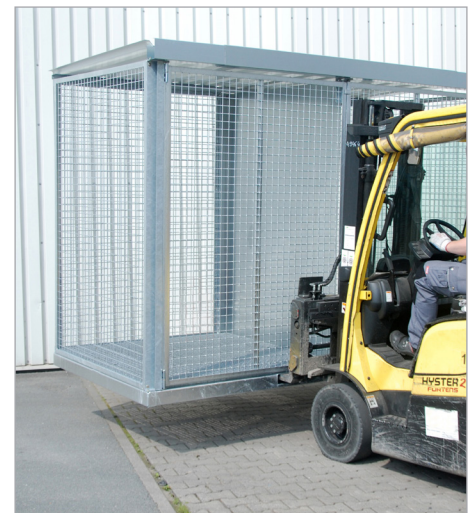
GFC-E/G (avec parois de séparations)