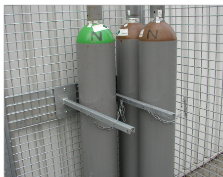
Dispositif de retenue