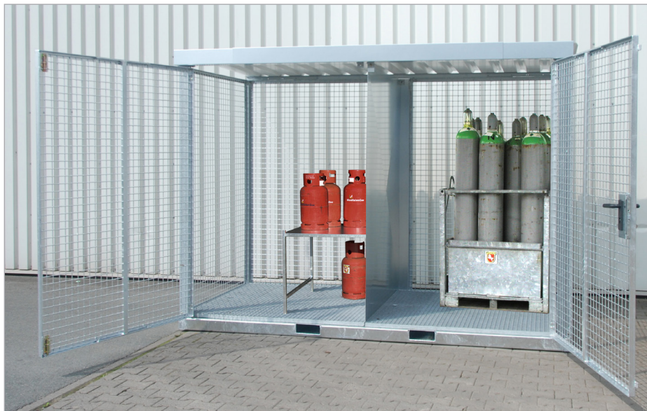
GFC-E/G (avec parois de séparations)