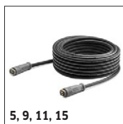
5, 9, 11, 15